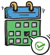
التقارير العالية السنوية

يراد بالمعلومات الدورية الوثائق والمعلومات التي تنشر للجمهور بدورية محددة، ويتعلق الأمر ب: